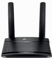
Router Wi-Fi N 4G LTE de 300 Mbps TL-MR100