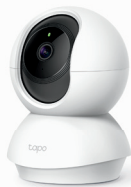
Cámara Wi-Fi Rotatoria de Seguridad para Casa Tapo C200